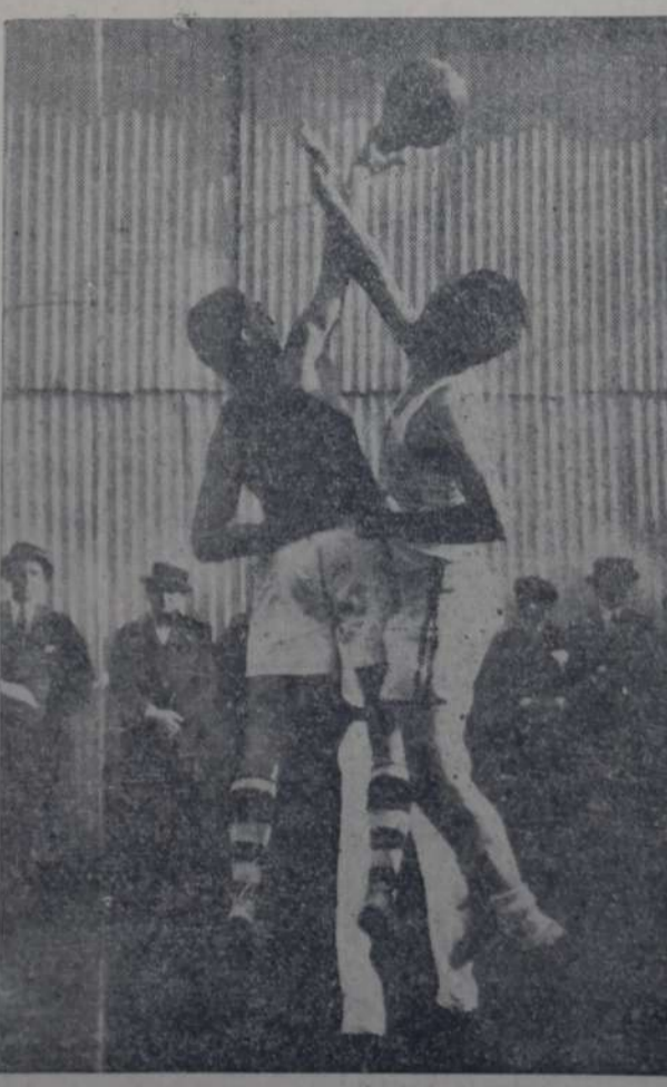
DISPUTANDOSE LA PELOTA AL INICIARSE EL PARTIDO DE BASQUETBOL Sportivo Barracas v. Independiente.