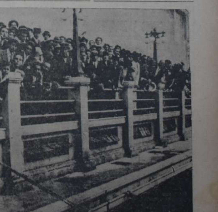
PARTE DE LA NUMEROSA CONCURRENCIA QUE ASISTIO AYER A LA PILETA DEL CLUB SPORTIVO Barracas con motivo del programa especial preparado por esta entidad...

Esta es la verdad. ¿Han oído los defensores de la "libertad de enseñanza"? Mucho más tendrán que oír aún al respecto.