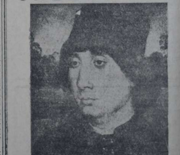
ANTONELLO DA MESSINA — "Retrato del desconocido".